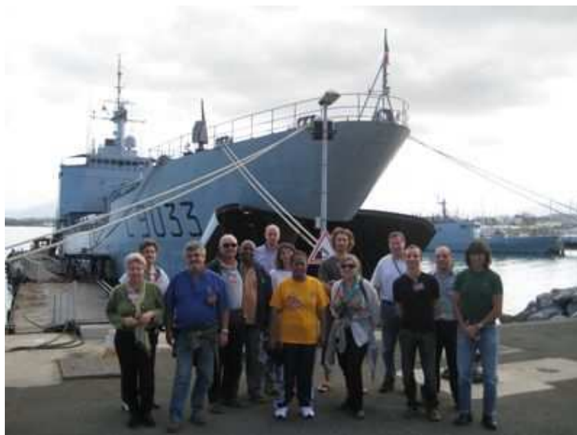
Le 14 août dernier, les premiers « moussettes », fin prêts pour une mission humanitaire !